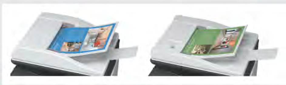
ALIMENTATORE DEGLI ORIGINALI