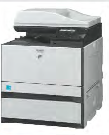
CASSETTO CARTA OPZIONALE DA 500 FOGLI