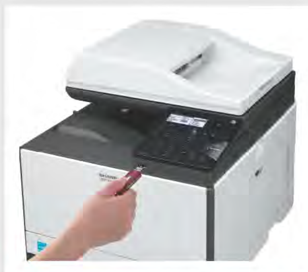
PORTA USB FRONTALE

Entrambi i modelli hanno in dotazione una comoda porta USB per stampare e scansare facilmente da una chiavetta. Inoltre, puoi connettere MX-C300W a una rete wireless e stampare direttamente dal tuo smartphone o tablet.